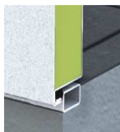
Przekrój: drzwi progowe