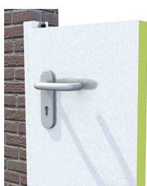
Widok: okucia nierdzewne